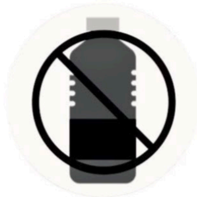
NO SHARING OF PERSONAL/ OFFICIAL BELONGINGS