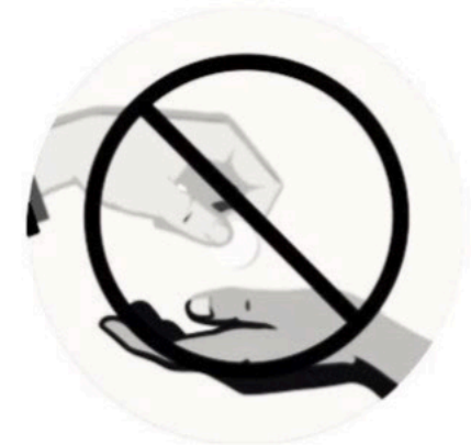
NO CASH TRANSACTIONS