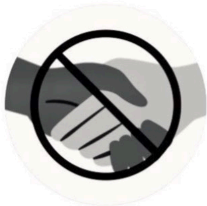
NO PHYSICAL CONTACT