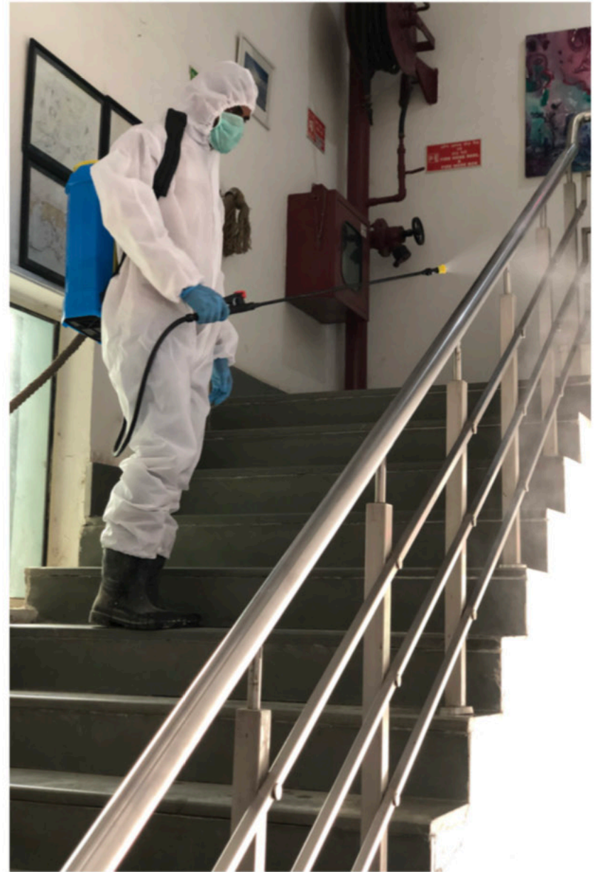
Sanitisation of the Factory before the staff and labour comes in.