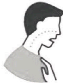
SHORTNESS OF BREATH